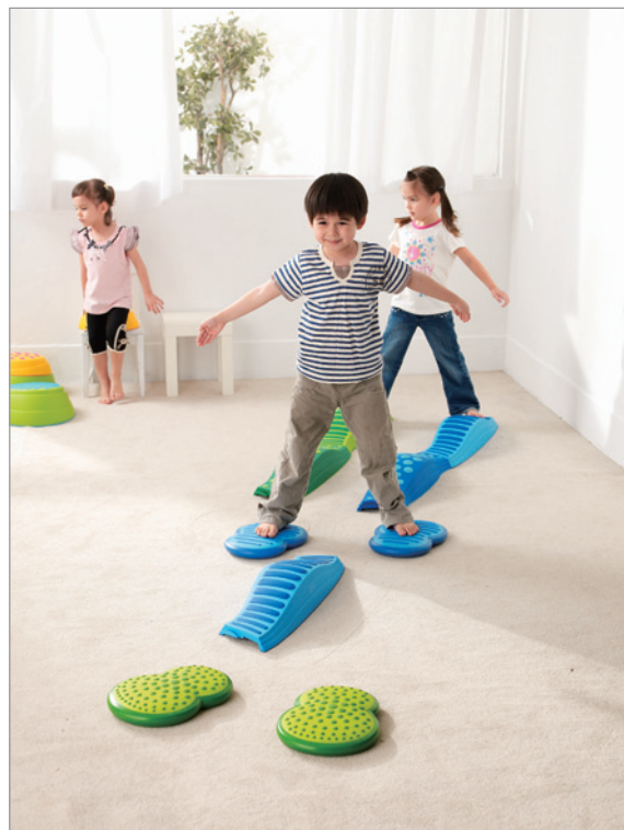
Activity 12 Wavy + Clouds (KT0009 + KT0012) 搭配波浪觸覺步道進行遊戲。