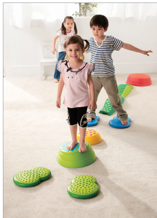
Activity 13 Wavy + Rainbow + Clouds (KT0009 + KT0008 + KT0012) 搭配彩虹河石及波浪觸覺步道進行遊戲。