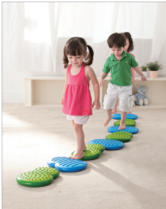
Activity 8 Multiple different routes can be organized (8 clouds, 2 sets) 無間隔連續排列，讓孩子做初步的行走練習。