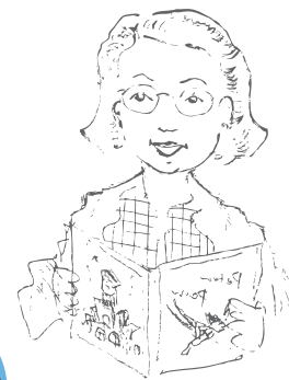
by Wendy Wu