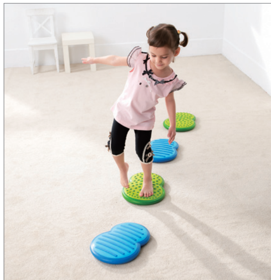
Activity 9 Stepping Forward (4 clouds) 間隔擺設平衡板，增進孩子行走時的平穩度。