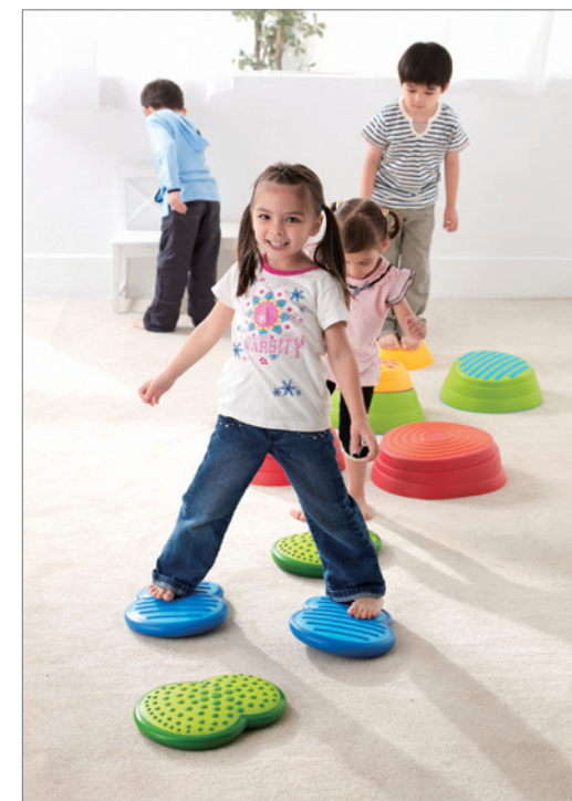
Activity 11 Rainbow + Clouds (KT0008 + KT0012) 搭配彩虹河石以跨步方式進行。