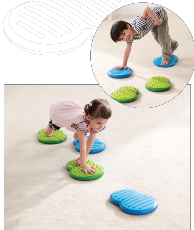
Activity 10 Crawling with Hands (4 clouds) 以爬行方式，增進動作協調及不同的行走體驗。